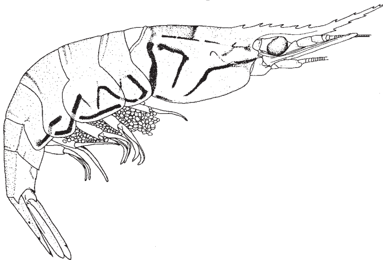
Fig. 1. Macrobrachium tenellum (Smith). Hembra ovígera

tres marcadas fajas longitudinales oscuras. La hembra ovígera del Macrobrachium tenellum (Fig. 1) ostenta por los lados del abdomen rayas cortas y un tanto anchas de color oscuro; estas rayas no se observaron en animales no ovígeras. Camarón de agua dulce de notable interés lo es el Potimirim glabra . Esta especie no se describió hasta el año de 1878, llegando el material tipo desde Nicaragua occidental. Después la literatura no hizo mención de otras pescas de esta especie hasta publicarse en 1954 a relación sobre el material coleccionado por el Dr. Boeseman. Estos camarones son animales (unos 2 cm de largo) que viven en agua puramente dulce. Son enteramente transparentes excepción hecha al dorso anaranjado con clara faja mediana longitudinal amarillenta. Esta faja que se extiende por todo lo largo del cuerpo es lo único que delata la presencia del animal en el agua. Estas rayas amarillas moviéndose en el agua mas bien se asemejan a palitos flotantes que a camarones.