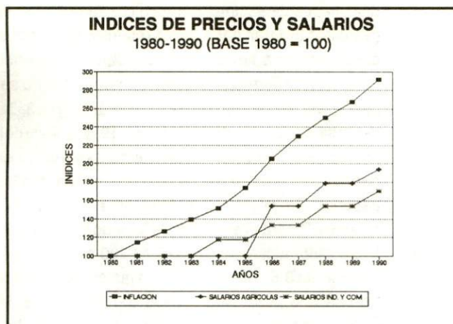
Grafico N° 2

La baja en el producto aceleró sin duda alguna, un mayor grado de disparidades sociales de las cuales vale la pena mencionar al menos dos: la agudización del desempleo y subempleo, y el consiguiente crecimiento del llamado "sectores informales urbanos". De acuerdo a la CEPAL, la tasa de desempleo abierto pasó de 6.7% en 1979 al 30% en 1984. 15