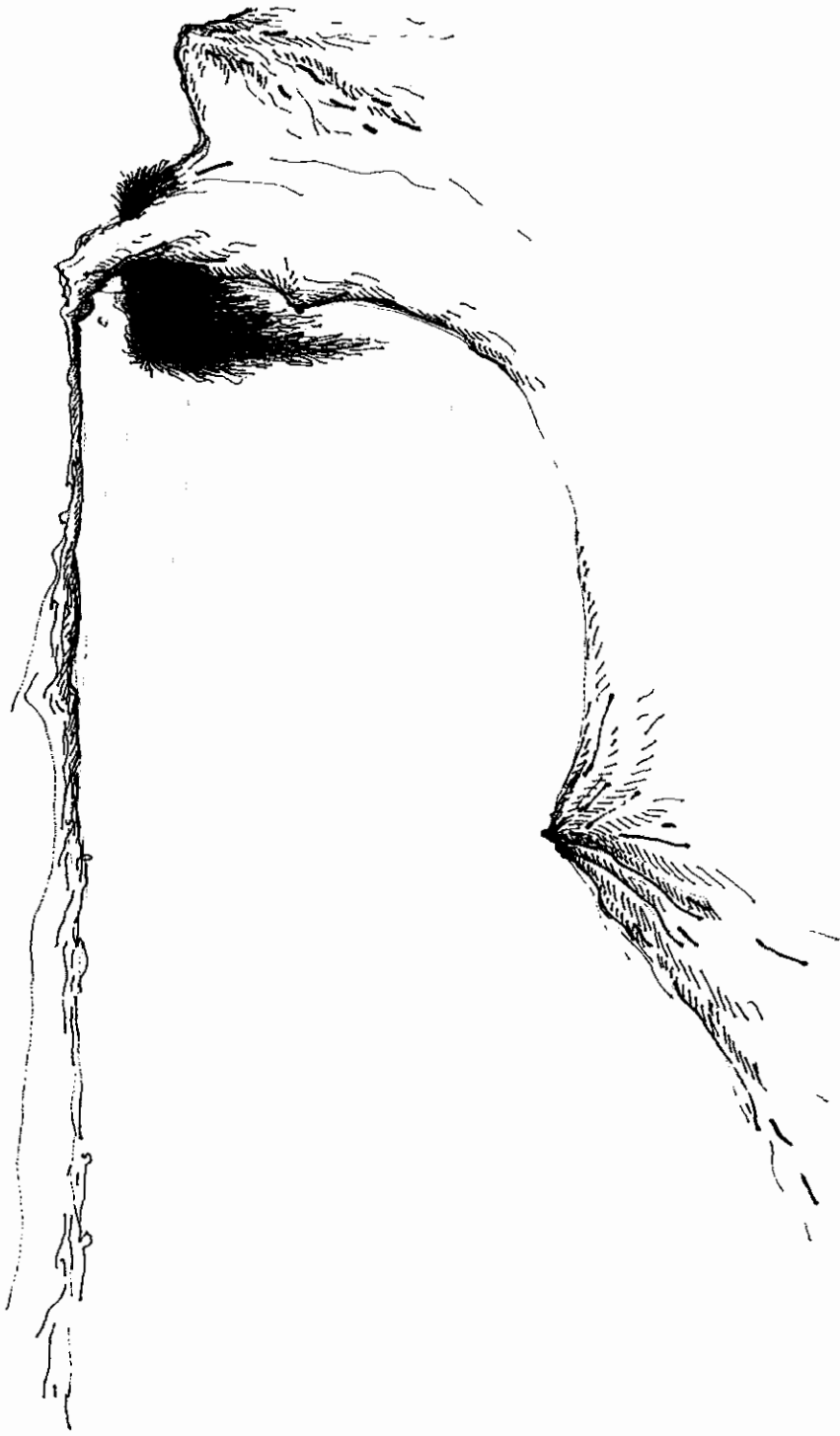
Fig. 100. Caprimulgus vociferans (Linn.) — Caprimulgus vociferans (Linn.)