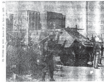
EL ESTADO DE DICC. JULIO 17. 0. 1972. 2 VIGILANCIA EN ENTRADAS A LA U. — Vehículos blindados y mostraron medios de la internacionalización fueron utilizados ayer al momento por los cuerpos de seguridad para tomar la Universidad Nacional, al declararse ilegal la elección de los miembros autoritarios del estu- dente. Los carros de guerra y las entradas a la Universidad fueron controladas por efectivos armados. Al fondo el edificio de la Facultad de Medicina.

La Corte Suprema de Justicia emitió, en secreto, al medio día del 18 de julio, la resolución acogiendo favorablemente el recurso. Al día siguiente, la Asamblea Legislativa, a instancias del Poder Ejecutivo, derogó la Ley Orgánica de la Universidad, basada en la nulidad de la elección. Ese mismo día se hizo la publicación en el Diario Oficial. Simultáneamente, cuerpos de Seguridad del país ocuparon la Universidad y Centros Regionales, con despliegue de fuerza armada abrumador (tanques, helicópteros, aviones militares, "Rangers", etc.). Previamente se capturó al Rector, Secretario General y Fiscal de la Universidad, quienes se habían hecho presentes en el Congreso