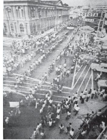
Marcha en San Salvador.

El 26 de junio de 1980, la Universidad de El Salvador fue ocupada nuevamente por la Fuerza Armada, que destruyó muebles,