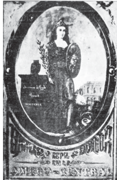
Primer escudo de la Universidad de El Salvador (del Salvador)

Artículo 2º. - Se recibirán en el Colegio de cuenta de la hacienda pública, doce niños pobres que vistan beca, quienes deberán saber leer, escribir y aritmética; que no