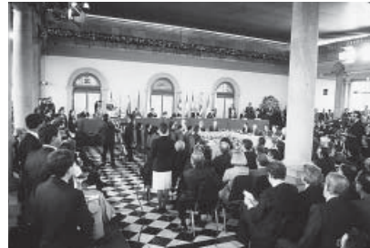
Firma de los Acuerdo de Paz.