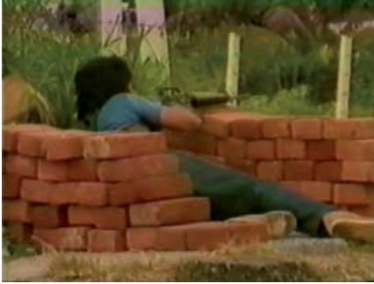
Combatiente del FMLN durante la ofensiva "Hasta el tope" de 1989.

Hasta el final de la Guerra Civil de El Salvador (1980-1992), la UES sufrió un período de decadencia. El 12 de noviembre de 1989, dentro del contexto de la ofensiva insurgente lanzada por el FMLN el día anterior, la UES fue objeto de una última intervención militar que la mantendría cerrada hasta el siguiente año.