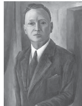
Dr. Sarbelio Navarrete.

La coyuntura mundial desfavorable a los países del eje obliga al dictador a dar un viraje en sus simpatías políticas, declarando la guerra a los países nazifascistas, y alineándose en una política pronorteamericana.