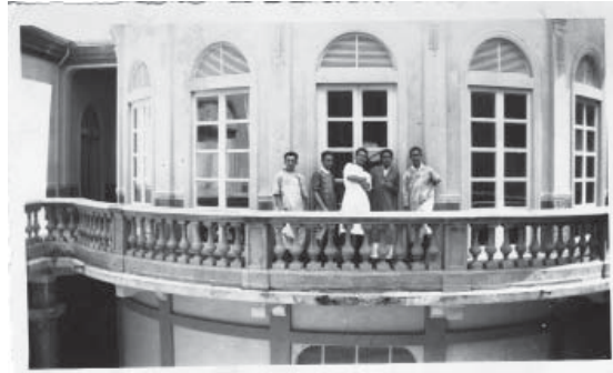
Edificio de la Universidad de El Salvador, conocido como La Rotonda.

El nuevo Rector era el típico libre pensador, adverso al régimen imperante del oficialista Partido Revolucionario de Unificación Democrática