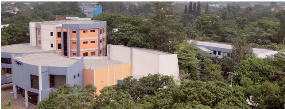
Edificios nuevos de la UES, fruto de la remodelación del año 2002.

A partir de 1999 surgen la Unión de Estudiantes Revolucionarios Salvadoreños 30 de Julio (UERS-30) así como una nueva generación de