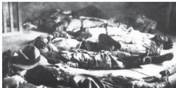
Campeños muertos, en 1932.

La insurrección fue aplastada por el ejército, con una fuerte represión que, en pocas semanas, provocó entre 15,000 y 30,000 muertos, pues nunca se supo la cifra exacta de la matanza, que se centró en la población indígena de la región de los Izalcos.