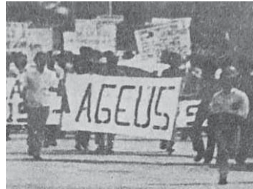
Marcha en la que participó AGEUS.

En 1931, fue elegido Presidente de la República el Ingeniero Arturo Araujo, del Partido Laboral, un miembro de la clase dominante que, sin embargo, durante su época de estudiante en Inglaterra, había sido influido profundamente por el laborismo. Estas elecciones presidenciales se tienen por las más democráticas de la historia del país. La coalición que lleva a la Presidencia de la República al Ingeniero Araujo incluye al Partido Laborista, que él preside, al Movimiento Vitalista del filósofo Alberto Masferrer, autor del “Minimum vital” e ideólogo del gobierno, y al teósofo General Maximiliano Hernández Martínez, fundador y líder