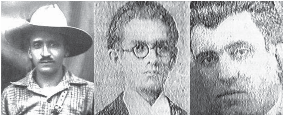
Farabundo Martí.