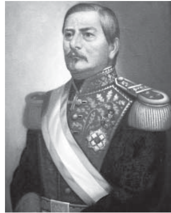
Gral. Gerardo Barrios. Oleo sobre tela. Valero Lecha. No. de inventario: 86-1404-0001. Biblioteca Nacional.

No obstante el “despotismo ilustrado” de Barrios, su proyectada reforma liberal no avanzó debido a la enconada oposición del clero y los sec-