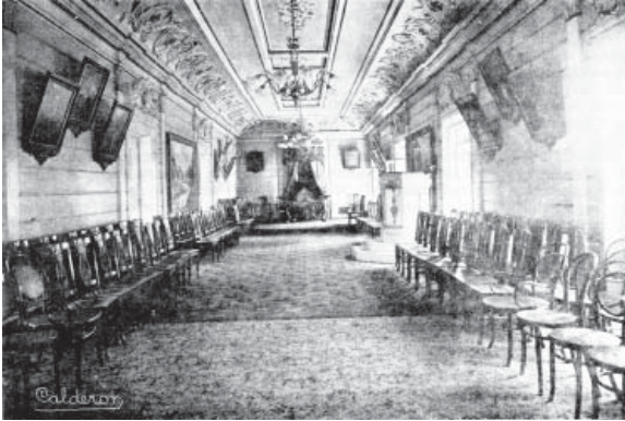
Paraninfo de la Universidad de El Salvador.