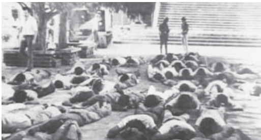
Estudiantes universitarios son obligados a tirarse boca abajo durante la ocupación de la UES en 1980.