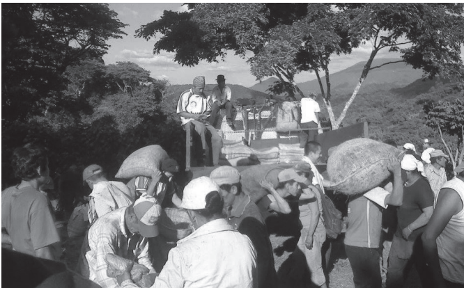
Figura 3. Cortadores de café en finca Montenegro

Nota. Fuente: foto de la alcaldía de Talnique.