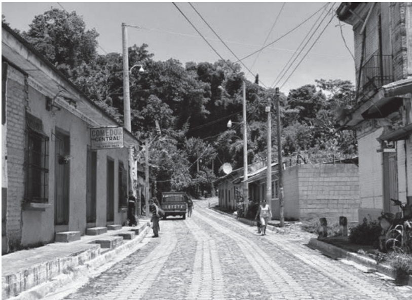
Figura 2. Calle Dr. José Santos Morales

Nota. En la esquina de esta calle, enfrente de lo que hoy es la sede del partido ARENA, miembros de la Defensa Civil mataron a un vecino del pueblo.