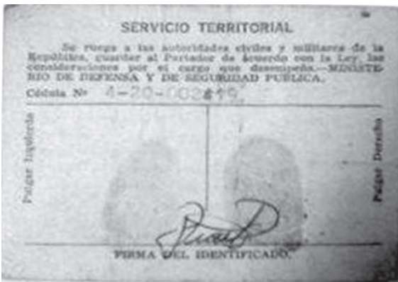
Figura 7. Carné de Servicio Territorial, parte trasera

Nota. Carné de Servicio Territorial. Propiedad de un habitante de Talnique.