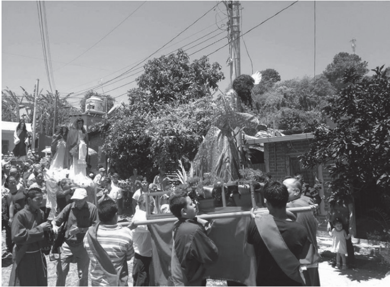
Figura 5. Procesión del viacrucis

Nota. Fuente: foto alcaldía de Talnique.