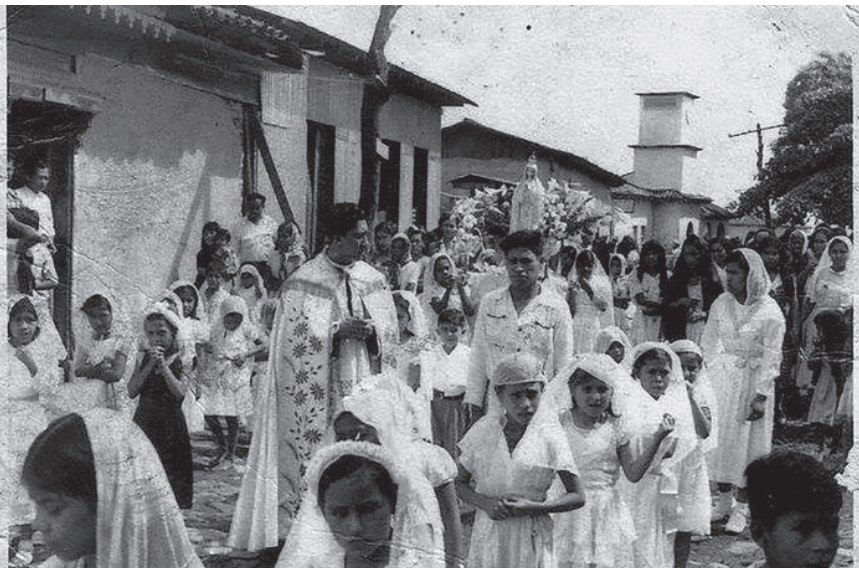
Figura 1. Fotografía de una celebración religiosa en Talnique

Nota. Fuente: propiedad de un habitante de Talnique.