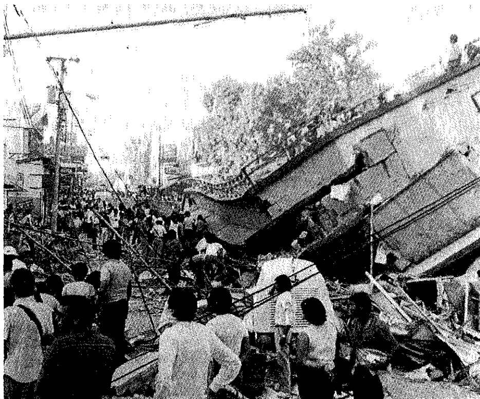
El terremoto del 10 de octubre de 1986, agravó la situación socioeconómica de El Salvador