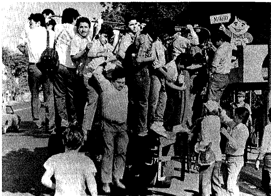
CUADRO No 2

Como su nombre lo indica, las centrales generadoras producen la energía eléctrica a partir de diversas fuentes (hidráulica, térmica, geotérmica, etc.). Esta energía debe ser transportada desde las centrales de generación, hasta los centros de consumo por