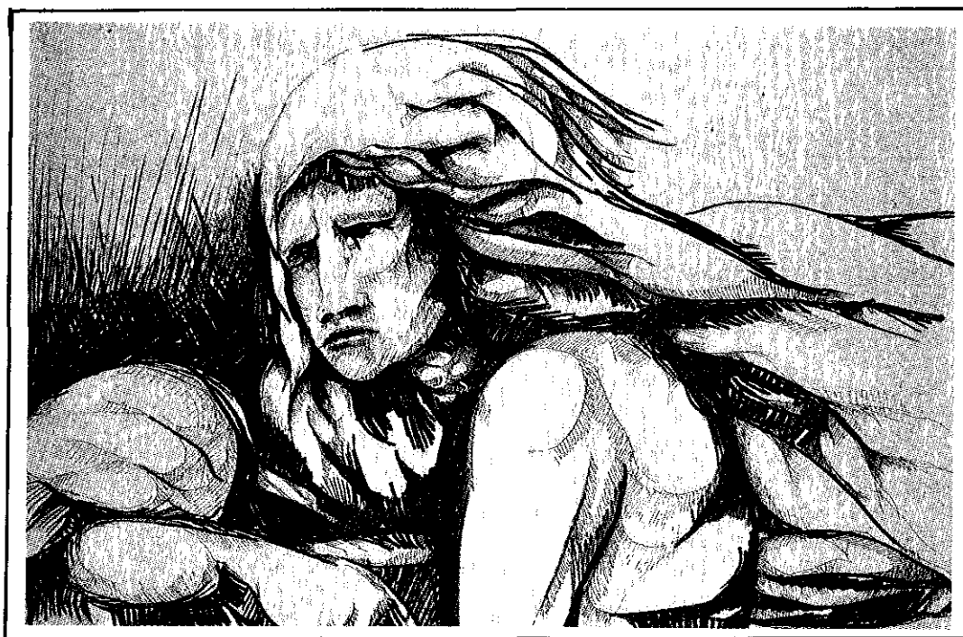
Técnica: Tinta China Tema: COMADRES Autor: Álvaro Sermeño Dimensión: 64 x 49 cms.

Finalmente, lo más grave no es el desconocimiento de la obligatoriedad de los Convenios, sino que son violados como resultado de la estrategia integral de contrainsurgencia. La principal fuente de las violaciones a los derechos humanos deriva de la decisión de aterrorizar y aniquilar a la población civil que vive en las zonas controladas o en disputa por el FMLN, con el propósito de reducirles su base social para aislarlos de la población. En esta perspectiva debe enfocarse tanto los bombardeos como los desalojos forzados de la población civil. ●