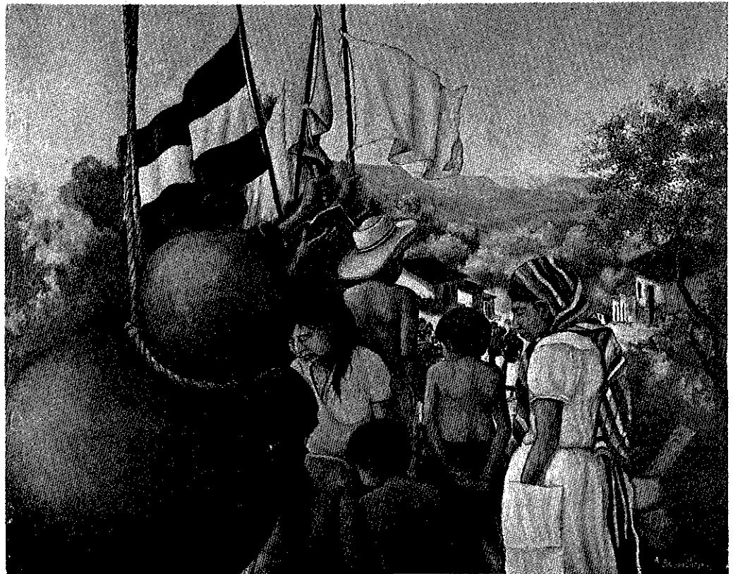
Técnica: Óleo sobre tela Tema: "El Pueblo" Autor: Álvaro Sermeño Dimensión: 47 x 59 cms.

En conclusión, las opciones son pocas y con escasa viabilidad; ha llegado el momento, entonces, de considerar modelos alternativos, poco ortodoxos