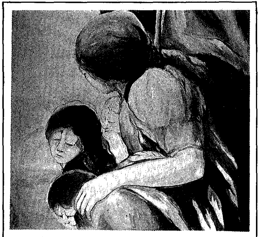
Técnica: Aguada Tema: Las Mujeres y sus banderas Autor: Álvaro Sermeño Dimensión: 57 x 67 cms.

Del resto de Europa no esperamos mucho, de España, era lógico esperar lo Ojalá que algún día zarpe una Pinta II, y cuando algún marinero (o piloto o cosmonauta, da lo mismo) descubra, por fin, una América inédita pero real, dé el aviso con salvos