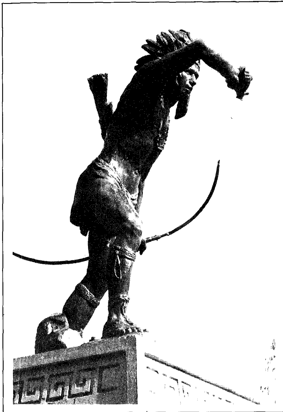
Atlacatl, símbolo de la resistencia salvadoreña contra la opresión colonialista.