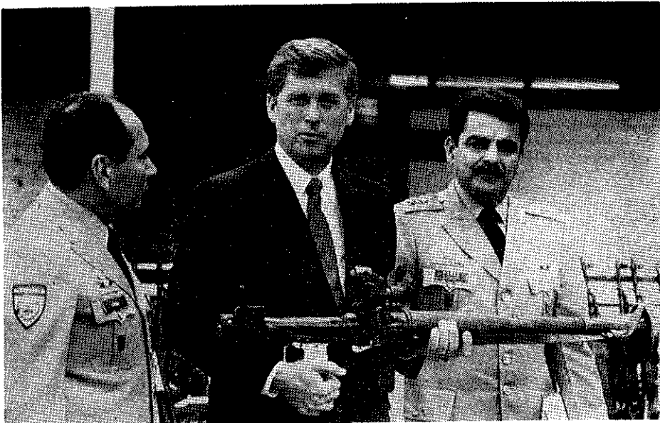
Dan Quayle, Vicepresidente de EEUU

En esencia, la visita del Vicepresidente Norteamericano, se realiza como resultado de la preocupación