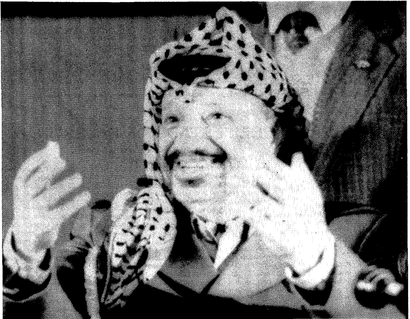
Yasser Arafat, máximo dirigente de la OLP

Guerra Mundial. Este hecho provocó una serie de protestas entre la población de origen palestino, que veían seriamente amenazados sus derechos con una inmigración cada día más creciente. Ante una situación cada vez más explosiva Inglaterra propuso un plan de partición de Palestina en 3 Estados: Judío al norte, Árabe al sur y un territorio controlado por la Administración Británica que estaba situado en el corredor Jerusalén-Jaffa. Este proyecto fue rechazado inmediatamente por los árabes, quienes iniciaron una rebelión que concluyó en 1939, cuando los ingleses abandonaron dicho proyecto, pero además limitaron