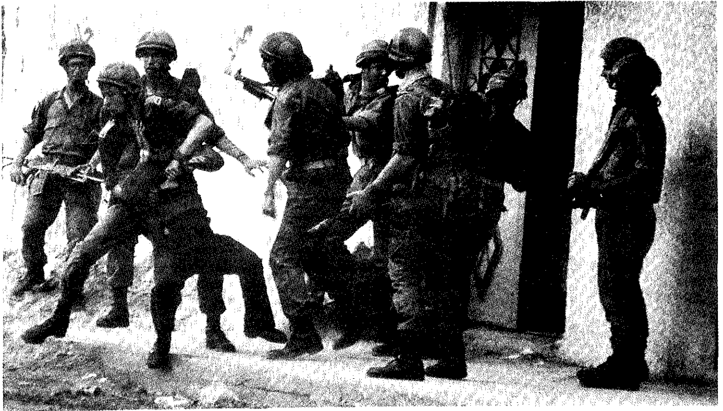
Soldados Israelíes "secuestran" a un ciudadano palestino, residente en la zona ocupada de la franja de Gaza