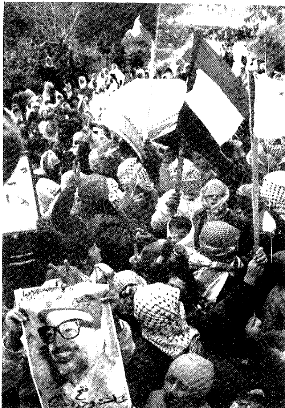
Partidarios de Arafat celebran triunfo palestino

La proclamación de un estado palestino en los territorios de la franja de Gaza y los situados en la margen occidental del Jordán teniendo por capital Jerusalén, es el resultado de una larga lucha del pueblo palestino por una patria que históricamente les corresponde y que debido a la oposición de Israel apoyado por Estados Unidos y otros países de la alianza atlántica,