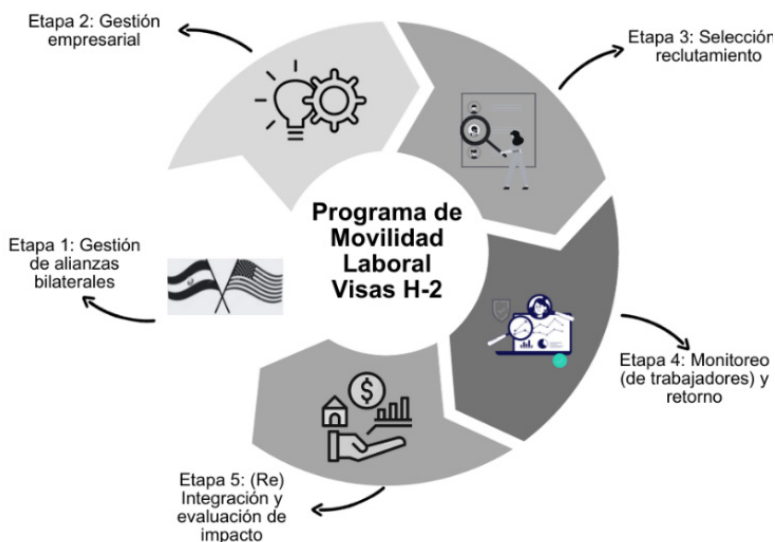
Figura 2. Las etapas del Programa de Movilidad Laboral Visas H-2

Nota. Elaboración propia con base en ONU – OIM, Programa de Movilidad Laboral Regular, Ordenada y Segura.