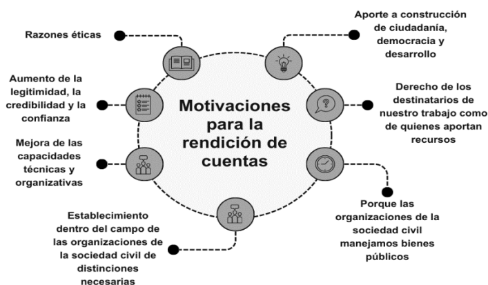
Figura 1. Motivaciones para la rendición de cuentas

Nota. Elaboración propia con base en el Manual para las Organizaciones de la Sociedad Civil: Transparencia, Rendición de Cuentas y Legitimidad.