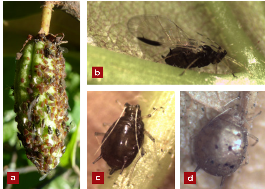
Figura 3. Toxoptera aurantii (Boyer de Foscolombe, 1841): a) colonia de ninfas y adultos en fruto de cacao; b) adulto alado; c) adulto áptero; d) áfidos áptero parasitado por Lysiphebus testaceipes (Cresson).

(Artiga 1994). Constituyen un problema serio en plantas de viveros y sobre todo en injertos jóvenes. La producción de mielecilla excretada por los insectos se acumula en el haz de las hojas y los frutos, dando lugar al hongo negro Capnodium sp. (fumagina), que reduce la fotosíntesis (Coto y Saunders 2004). Las hojas de cacao fuertemente atacadas envejecen prematuramente (Schmutterer et al. 1990), reportándose deformaciones de los brotes tiernos de las plantas de cacao en Perú (Raven 1993).