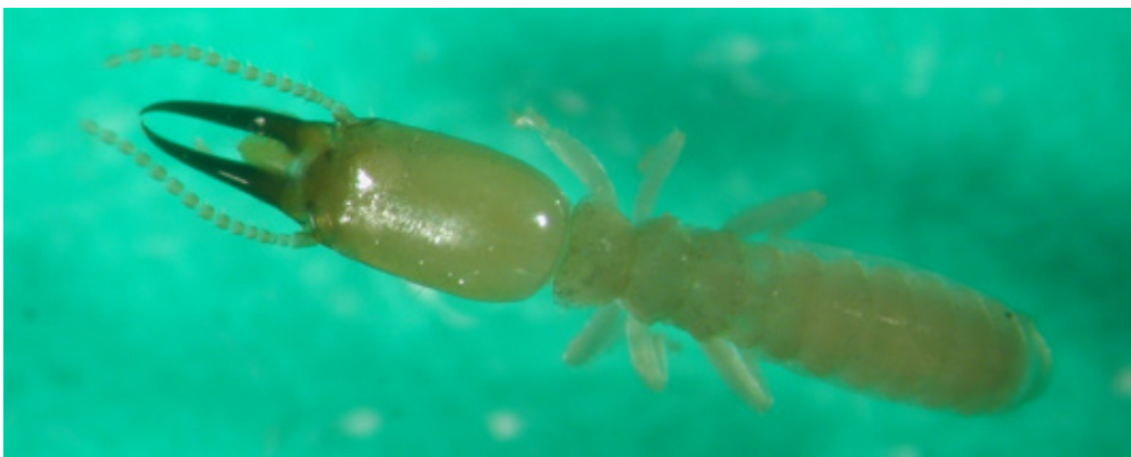
Figura 7. Casta de soldado de termita Heterotermes convexinotatus (Snyder, 1924).

Como enemigos naturales, las larvas por ser de hábitat subterráneo, son controladas fácilmente por patógenos. Los hongos ejercen un buen control y existen reportes que demuestran que cerca del 80% de las enfermedades de los insectos son causadas por hongos. Uno de los hongos más utilizados es Metarhizium anisopliae , que es fácilmente identificable por su coloración blanca, la cual posteriormente se vuelve verde olivo; pero a nivel de campo se han encontrado otros hongos como Cordyceps sp. , que atacan larvas de gallina ciega. También existen protozoarios, virus, bacterias y nematodos que causan mortalidad al insecto. Los adultos son controlados por moscas del género Pyrgota sp. , las cuales parasitan a los escarabajos o chicotes en pleno vuelo, colocando la mosca sus huevos en el interior de las alas de los escarabajos. Además, existen ectoparásitoides de larvas de gallina ciega, como, por ejemplo: Campsomeris dorsata (Hymenoptera: Scollidae) y Tiphia sp. (Hymenoptera: Tiphidae). También son importantes los sapos y lagartijas como depredadores. Bacterias entomopatógenas: Bacillus popilliae y Bacillus thuringiensis (Trabanino 1998; Sermeño et al. 2005).