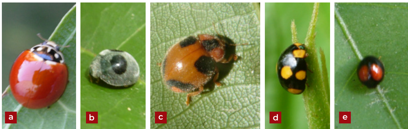
Figura 4. Coleoptera de la familia Coccinellidae depredadores de Toxoptera aurantii (Boyer de Foscolombe, 1841): a) Cycloneda sanguinea (L.); b) Azya luteipes ; c) Eupalea picta (Guerin-Meneville); d) Brachiacantha bistripustulata (F.); e) Adalia sp. Mulsant.

carnea (Stephens) (Neuroptera: Chrysopidae); Hongos entopatógenos: Acrostalagnus albus y Entomophthora sp. (Artiga 1994; Coto y Saunders 2004). En el presente estudio se han encontrado en plantaciones comerciales de cacao de El Salvador, los depredadores que se muestran a continuación.