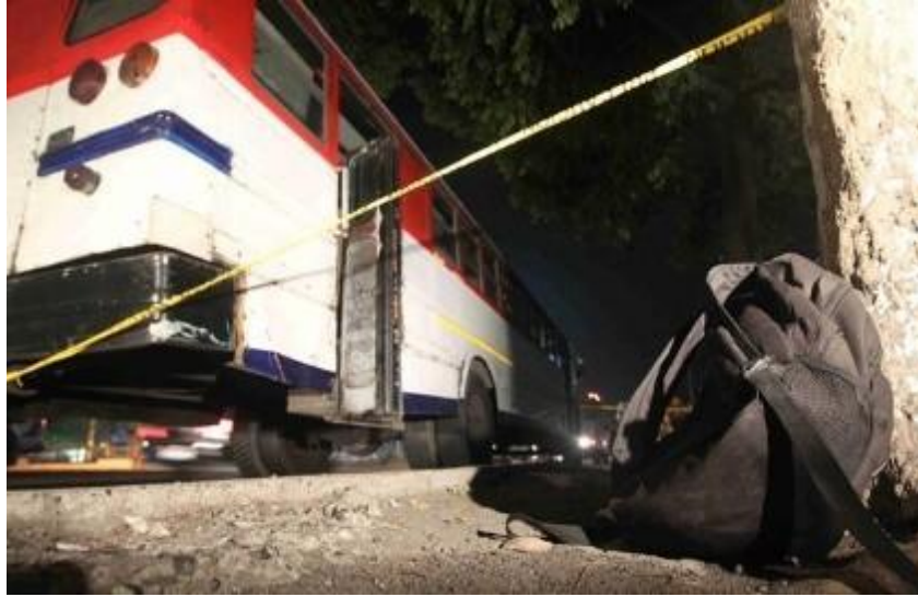
Tiroteo fue por rencillas estudiantiles. (Grafica, 2013)

Esa noticia se hizo famosa, pero era lo que nosotros vivíamos día a día. A partir de todo eso, y de mi propio medio en abrir caminos, obtuve una beca, saliéndome del instituto público, evitando altercados que me fueran a impactar, como el suceso del bus en el 2013, yo como niño tenía sueños que se me fueron arrebatados por el ambiente de violencia en mi país de ser Doctor, pero todo ha ido cambiando poco a poco. Una de mis otras experiencias es el sufrir un robo a mano armada en una de las salidas de la Universidad de El Salvador, justamente por la salida de ANDA - Administración Nacional de Acueductos y Alcantarillados, despojándome de mis pertenencias, sin pelear lo material, ya que mi vida estaba de por medio.