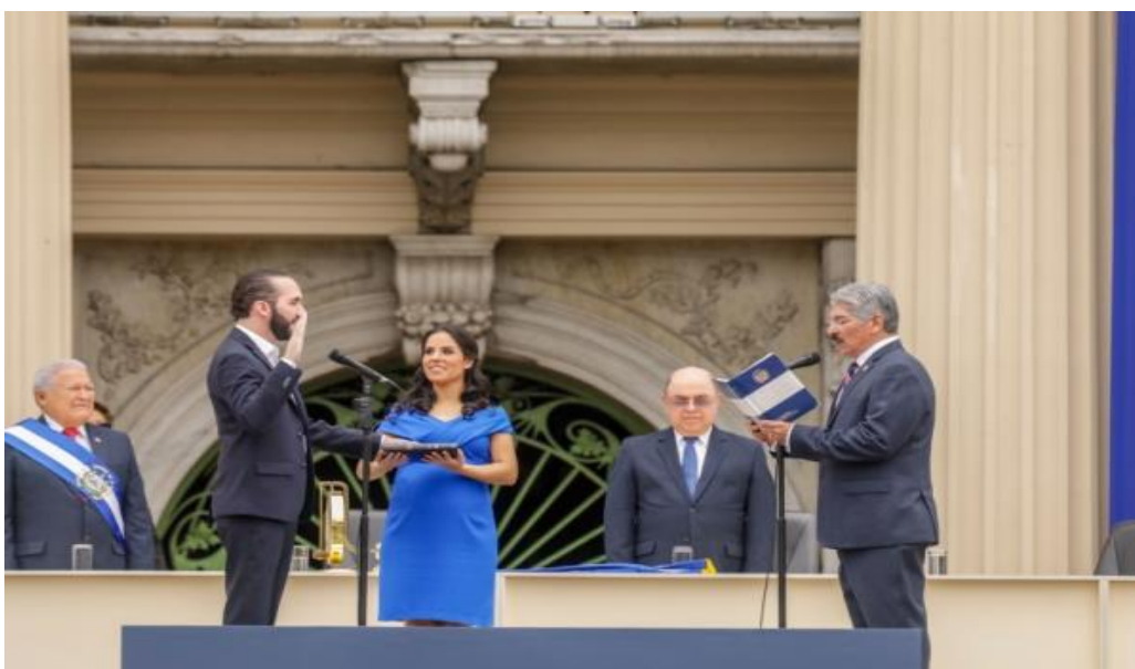
Foto: Nayib Bukele siendo juramentado para el período presidencial 2019-2024 en El Salvador.

lo Constitucional, pues toda resolución judicial, cuando alcanza el grado de firmeza -es decir que ya no existe un medio de impugnación posible dentro de nuestro ordenamiento jurídico- también es de obligatorio cumplimiento. En ese grupo de análisis simplista ubicamos al ciudadano común, quienes expresan constantemente en las encuestas que están dispuestos a apoyar a Nayib Bukele en su nueva candidatura, quedando plasmado ese apoyo en diversos sondeos de opinión con porcentajes altísimos, como por ejemplo en la encuesta de febrero de 2023 llevada a cabo por Tresearch 2 en la que casi el 94% de los encuestados dijeron que votaría por él.