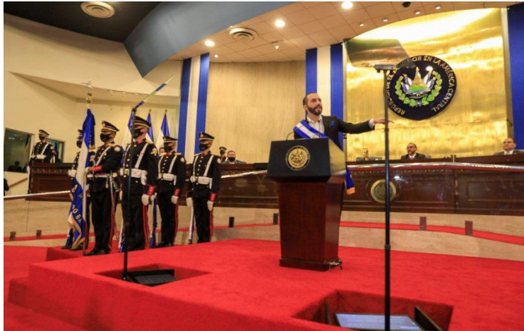
Foto: Nayib Bukele en uno de sus informes anuales ante la Asamblea Legislativa de El Salvador.

Todo lo dicho, sostiene la posibilidad real de competir como candidato a la presidencia por parte de Nayib Bukele en el proceso electoral del 2024, y los argumentos se ven reforzados por lo expresado en la resolución 1-2021 10 , en la que no se dice que se habilita la reelección al presidente, sino que para lo que está habilitado es para inscribirse como candidato para un segundo periodo, siempre y cuando reúna todos los requisitos que establecen las leyes secundarias, y haya presentado la licencia respectiva sin caer en la inhabilidad de ejercer la presidencia en los seis meses anteriores al inicio del periodo presidencial como ya se dijo.