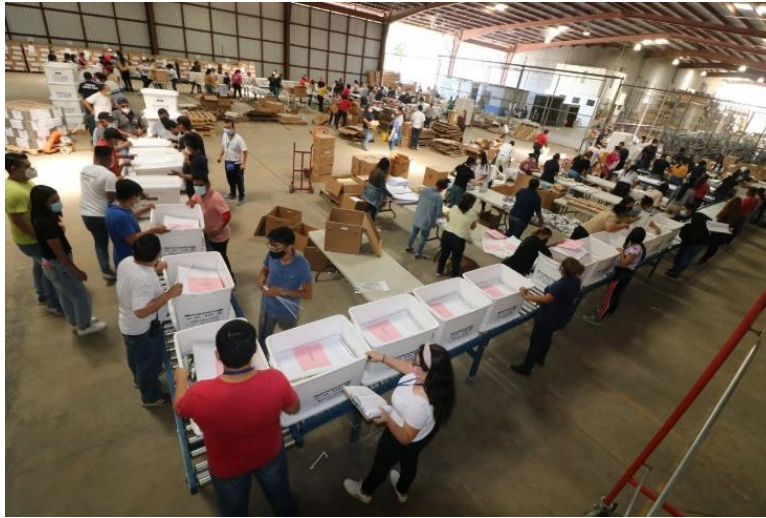
Foto: Personal del Tribunal Supremo Electoral trabajando en preparativos de las elecciones de 2021, en el año 2024 El Salvador tendrá elecciones generales.

Esto no representa una reelección propiamente dicha, pues para inscribirse como candidato, el interesado debe separarse del cargo de presidente, que le posibilite llevar a cabo tal inscripción, debiendo cumplir todos los requisitos que la Constitución y la legislación secundaria le exigen para tal fin, y así poder someterse nuevamente a la voluntad del electorado, dependiendo absolutamente del resultado en las urnas, podrá o no, iniciar un nuevo período presidencial.