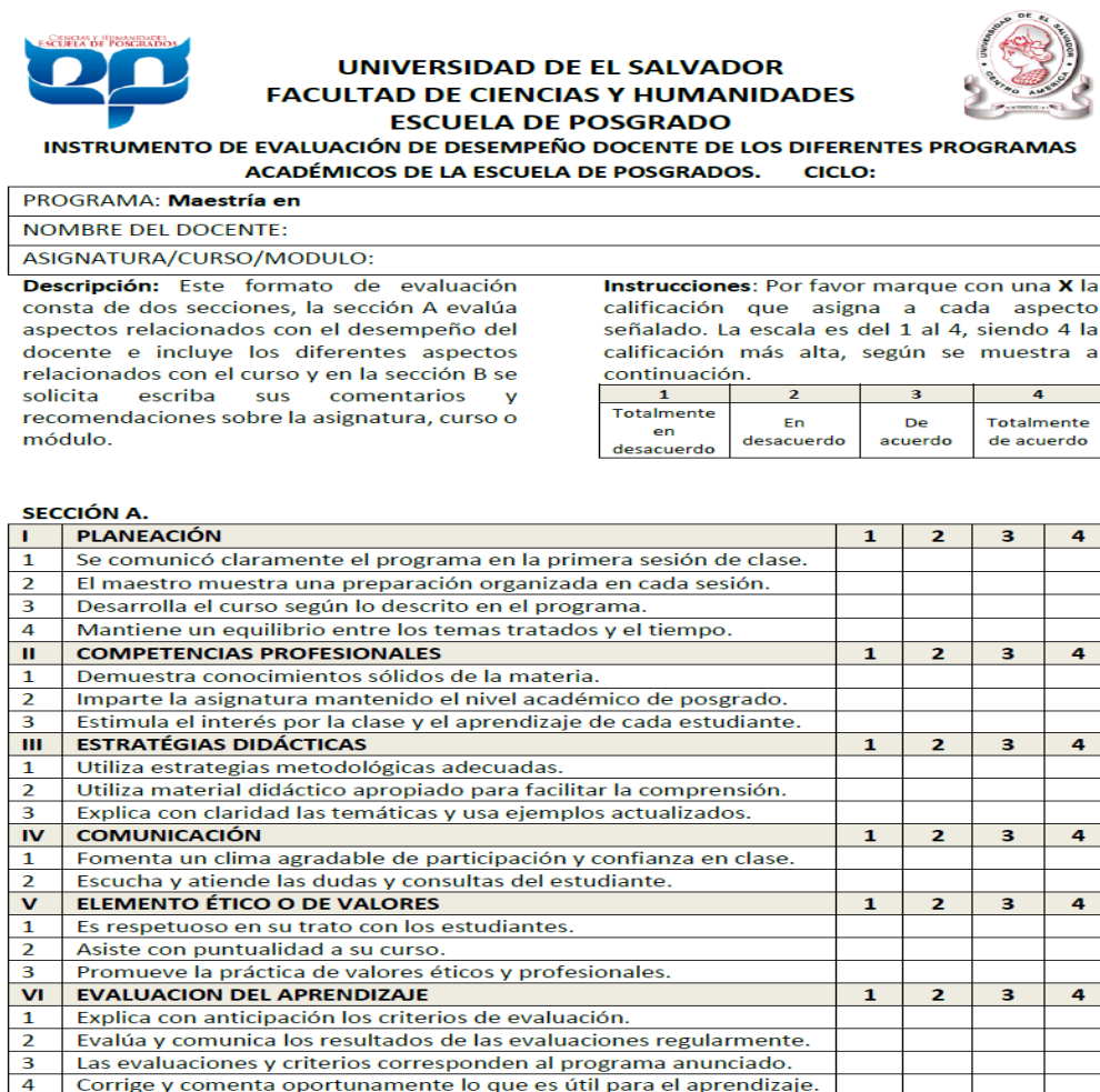
Imagen de sección A del instrumento evaluador del desempeño docente.