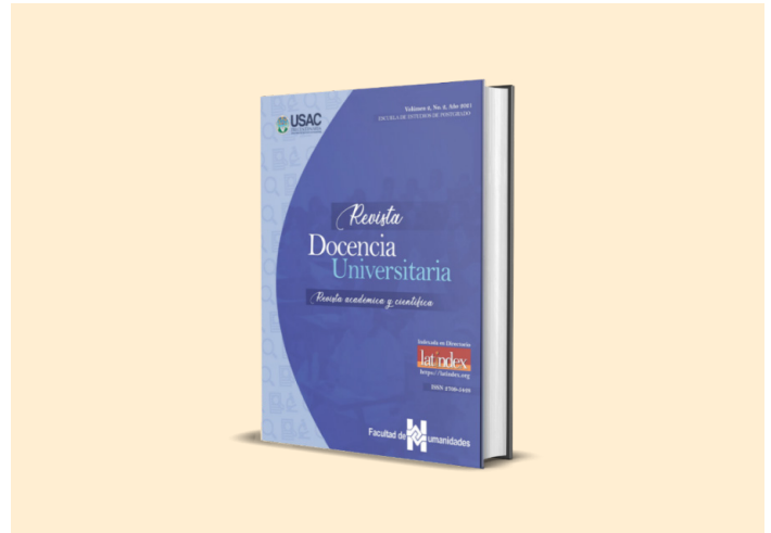
Figura 3 Portada de la Revista Docencia Universitaria

Nota. Adaptado de Revista Docencia Universitaria [figura]. Por Universidad de San Carlos de Guatemala, 2022, USAC ( https://www.revistadusac.comhttps://revistages.com ). CC BY 4.0