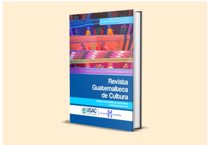
Figura 4 Portada de la Revista Guatemalteca de Cultura

Nota. Adaptado de la Revista Guatemalteca de Cultura [figura]. Por Universidad de San Carlos de Guatemala, 2022, USAC ( https://revistaguatecultura.com ). CC BY 4.0