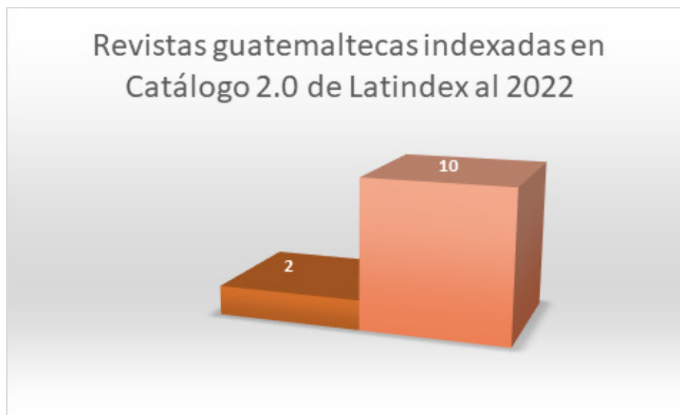
Figura 1 Revistas guatemaltecas indexadas en Catálogo 2.0 de LATINDEX al año 2022.

Nota. Guatemala como país desde el año 2019 tuvo un crecimiento en publicaciones, porque actualmente son 10 las revistas indexadas, poco a poco se encamina para incrementar la internacionalización de las investigaciones a través del surgimiento de revista indexadas. (Latindex - Sistema Regional de Información en Línea para Revistas Científicas de América Latina, El Caribe, España y Portugal, s. f.)