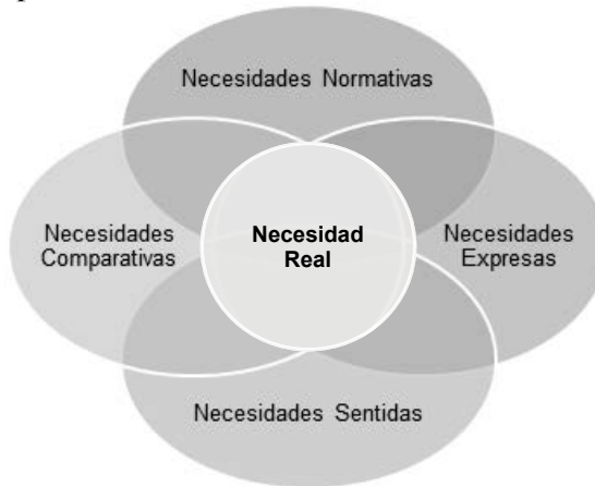
Figura 1. Representación de la utilización de cuatro tipos de necesidades para la identificación de una necesidad real

Fuente: Elaboración propia con base en la propuesta de Jonathan Bradshaw . Jonathan Bradshaw on Social Policy: Selected Writings 1972 – 2011 (York: University of York, 2013), 5.