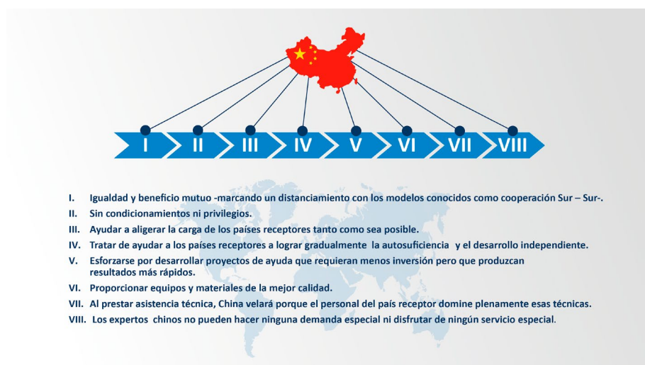
Ilustración 1. Los 8 principios de la cooperación internacional de China para el mundo