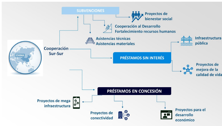
Ilustración 4. Tipos de CSS de la República Popular China en la nueva era