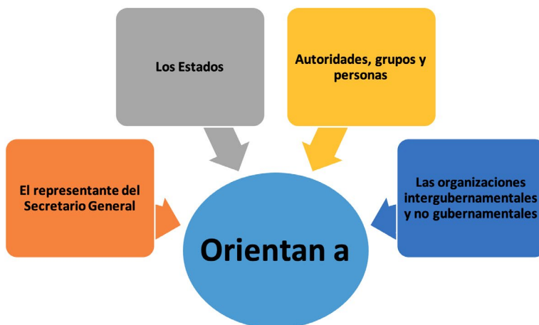
Figura 4. Finalidad de los principios